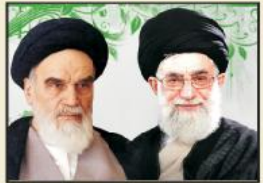
مقام معظم رهبری: امام خمینی (ره) بنیاد مسکن یکی از برگات مستمر و صدقات جاری امام راحل است از بنیاد مسکن که زحمات زیادی کشیده اند در ایران لشکر می گنم

نشریه داخلی بنیاد مسکن انقلاب اسلامی استان کردستان / شماره ۱۹ / تابستان ۹۳